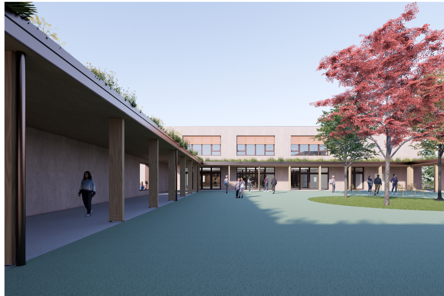
1. Vista dalla corte interna