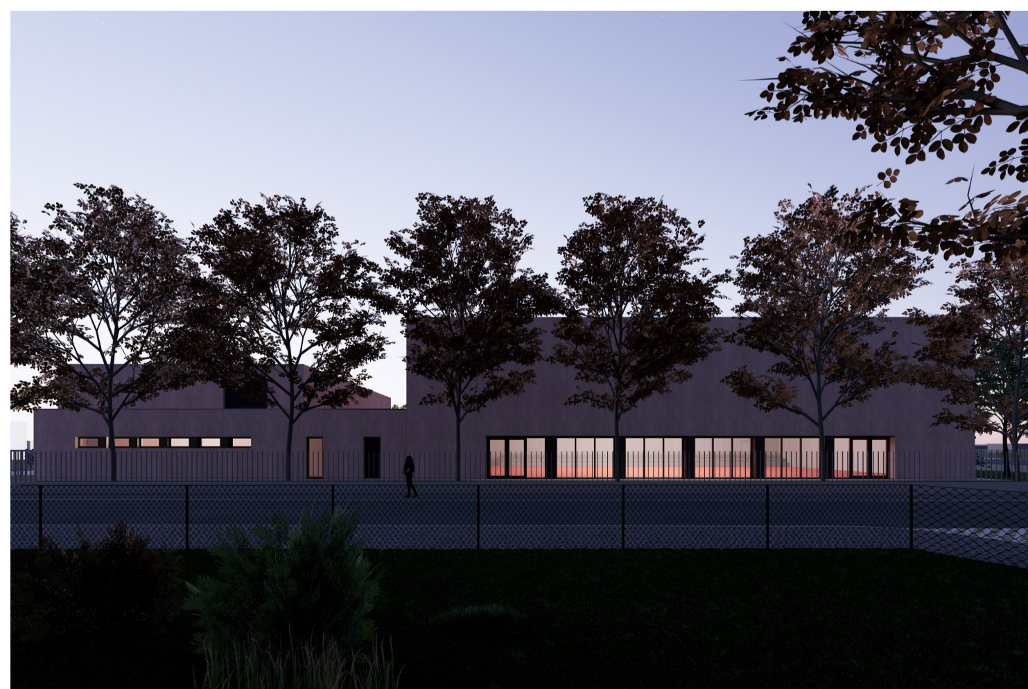
7. Vista della palestra da Via Papa Giovanni XXIII