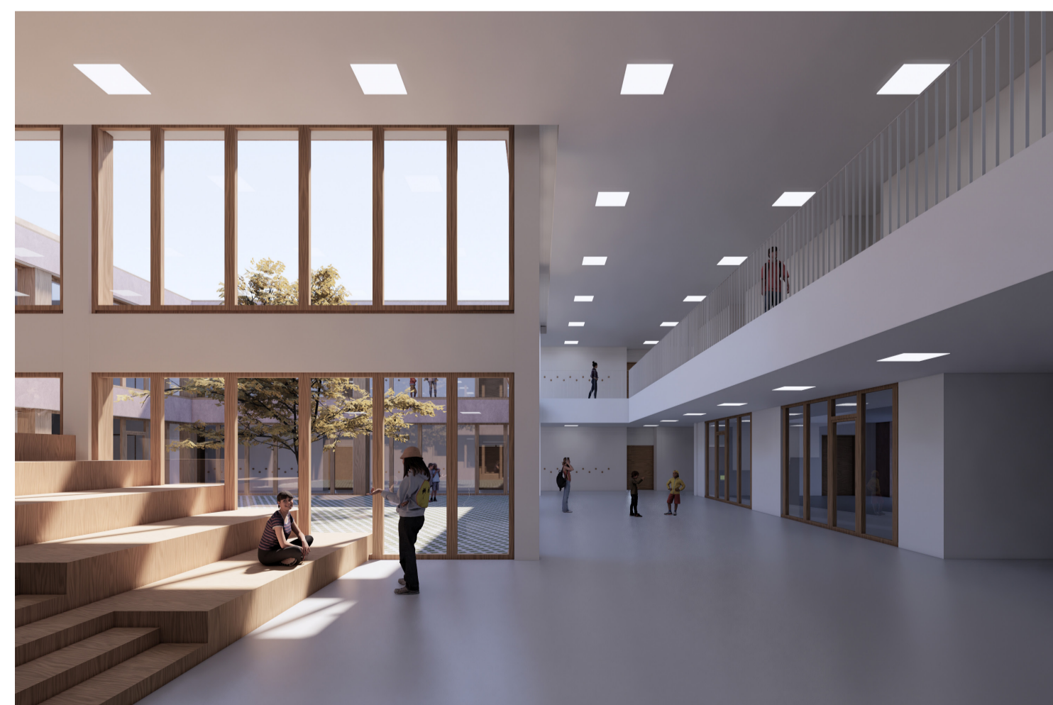
8. Vista dall'atrio

COMUNE DI BOTTANUCO Provincia di Bergamo NUOVO CAMPUS SCOLASTICO VIA J.F. KENNEDY, 8 PROGETTO DEFINITIVO