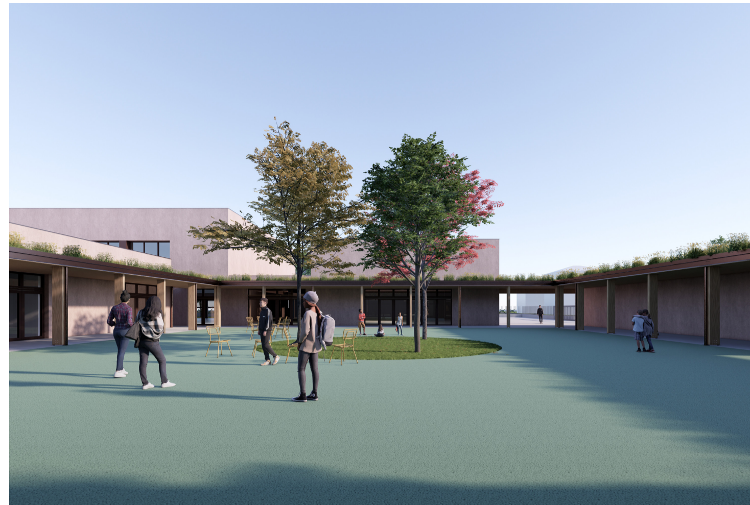
3. Vista dalla corte interna