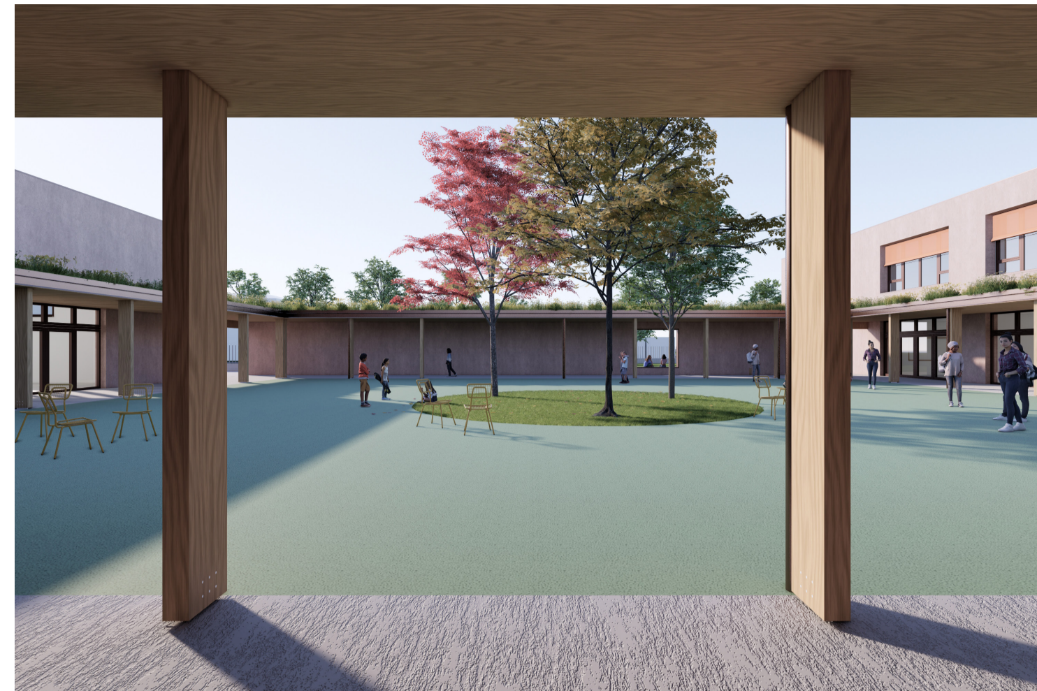
2. Vista dalla corte interna