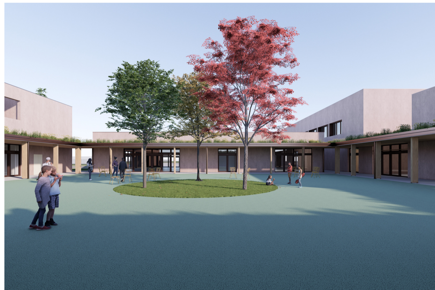
4. Vista dalla corte interna