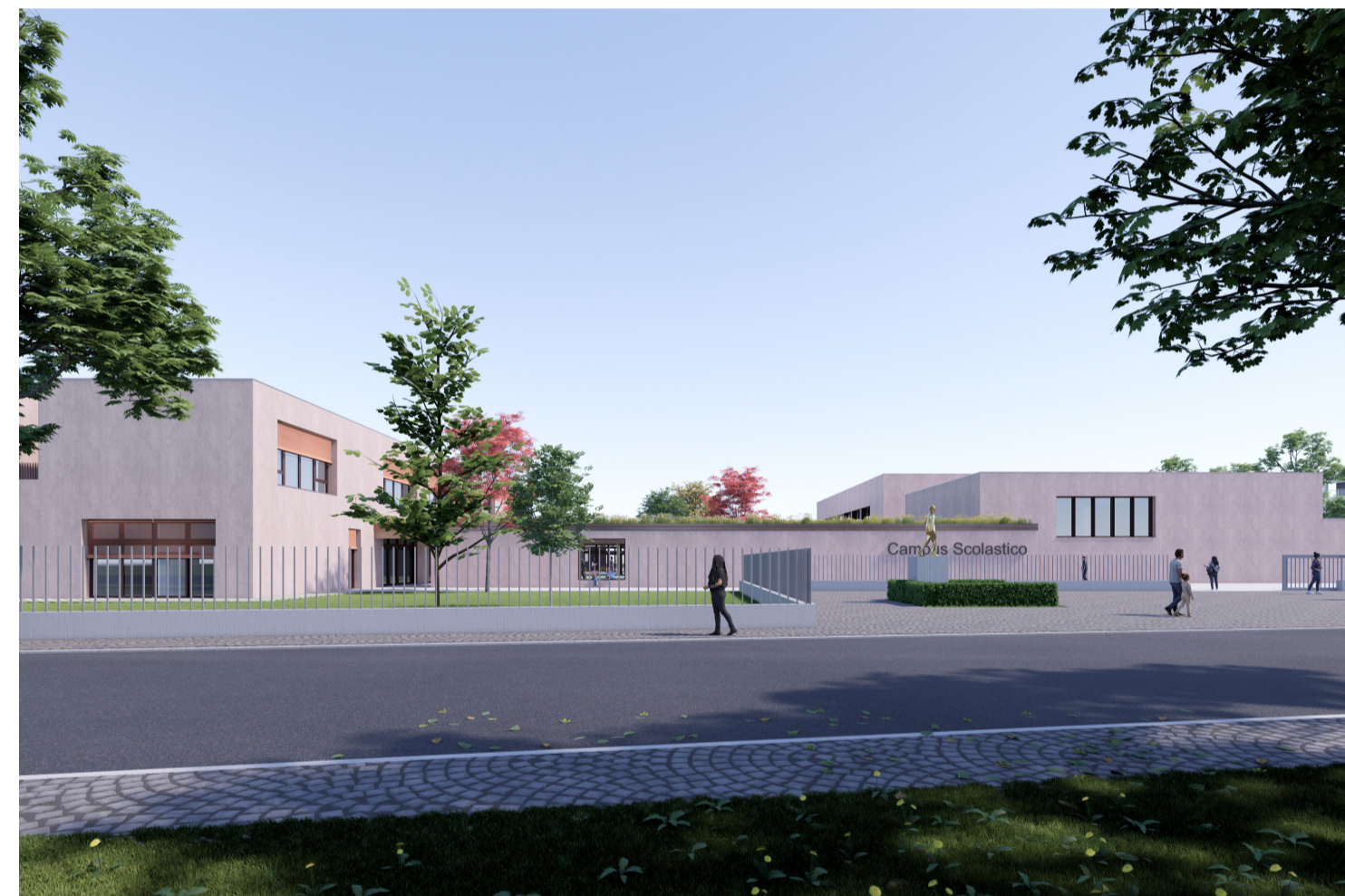
5. Vista da Via J.F. Kennedy