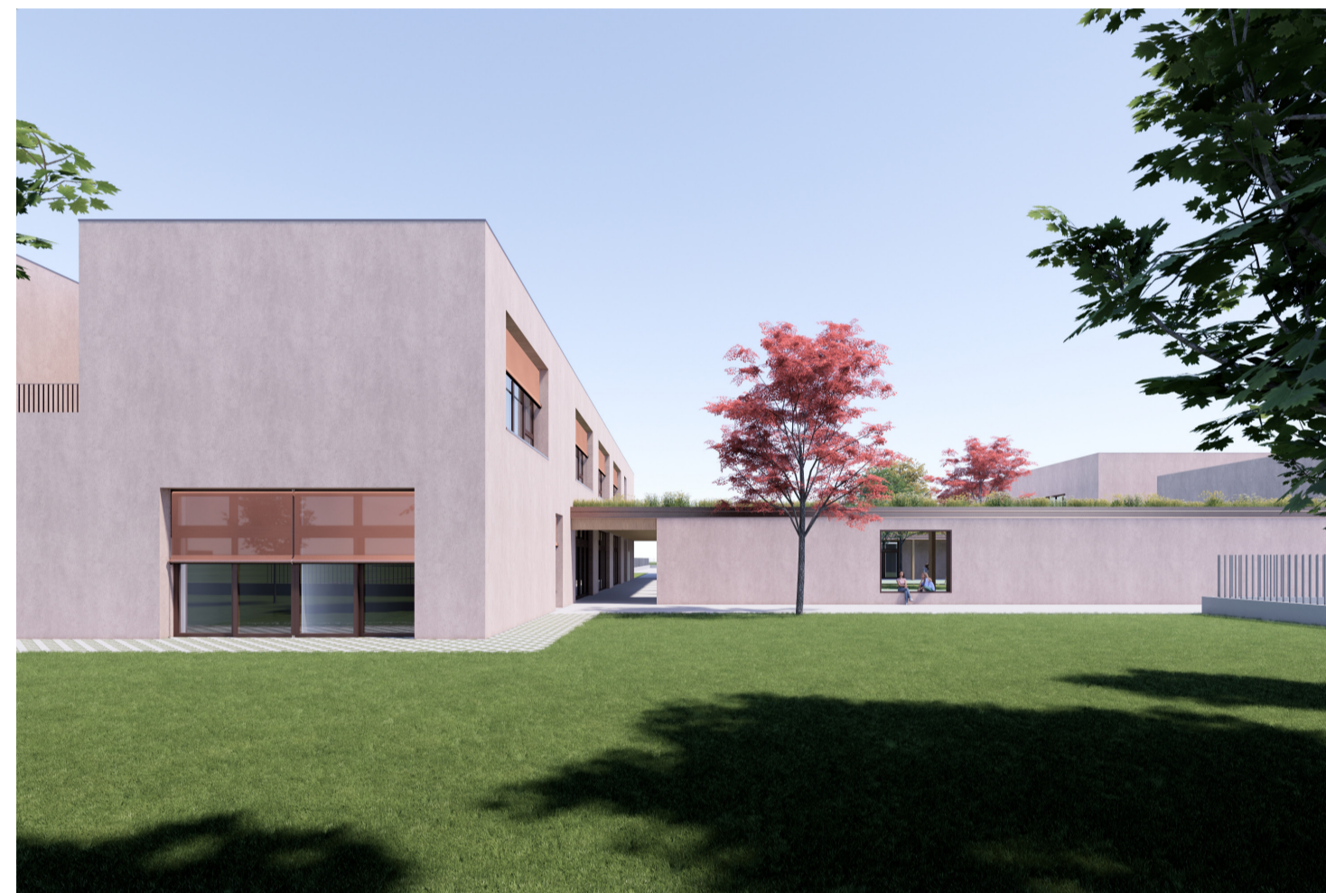
6. Vista da Via J.F. Kennedy