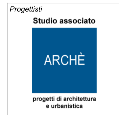
Tavola PR 01|02b

Gruppo di lavoro Studio associato ARCHÉ arch. Franco Resnati - arch. Fabio Massimo Saldini arch. Paolo Dell'Orto plan. Giorgio Limonta