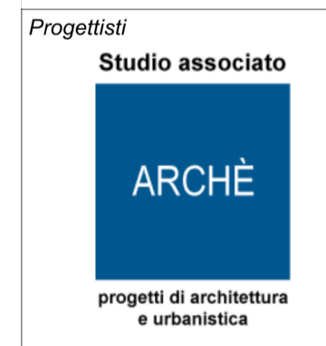
Tavola PR 01|02e

Progettisti Studio associato ARCHÉ arch. Franco Resnati - arch. Fabio Massimo Saldini arch. Paolo Dell'Orto plan. Giorgio Limonta